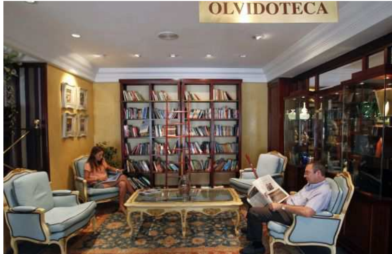
Clientes del hotel se entregan a la lectura en el espacio habilitado como Olvidoteca

El hotel Conde Duque monta una Olvidoteca con los libros abandonados por los huéspedes